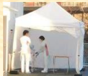
疑い患者様への対応