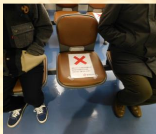
ソーシャル ディスタンス